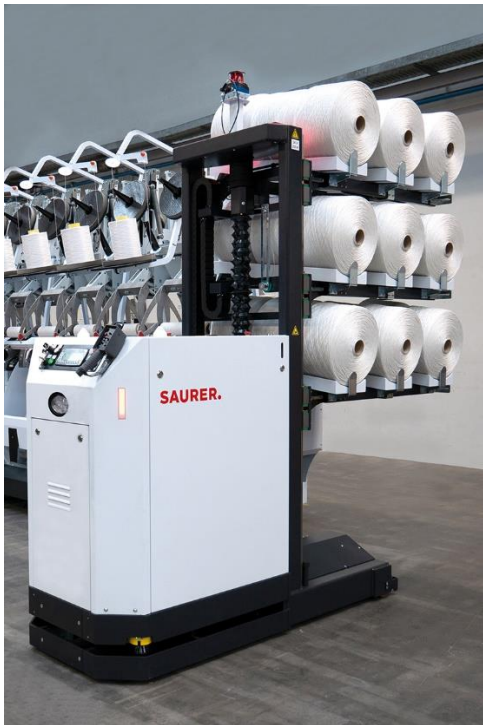
Vollautomatisches Flurfahrzeug PackDrive