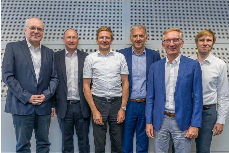
TUDALIT neuer Vorstand.jpg